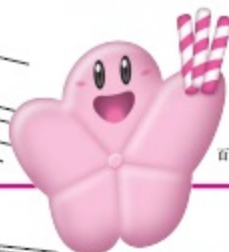
百工菓キャラクター 「うめ丸くん」