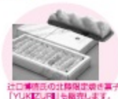
注：本場直営の比較級生菓子「YUKIJOYU」も販売します。